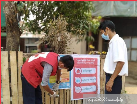
တနင်္သာရီတိုင်းဒေသကြီး