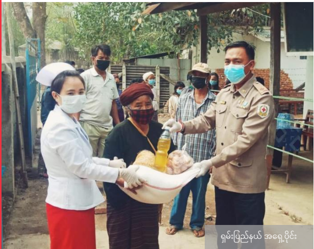
ရှမ်းပြည်နယ် အရှေ့ပိုင်း

ကြက်ခြေနီစေတနာ့လုပ်အားရှင်များမှ နိုင်ငံတော်မှ စားနပ်ရိက္ခာအိတ်များကို ဝင်ငွေနည်းပါးသောအိမ်ထောင်စုများအား ပံ့ပိုးပေးခဲ့သည်။ ယခုနှစ် သင်္ကြန်ရုံးပိတ်ရက်များသည် COVID-19 ကြောင့် ရေပက်ဆော့ကစားခြင်းမရှိဘဲ ပုံမှန်နှစ်များနှင့်မတူ တိတ်ဆိတ်လျက်ရှိသည်။ သို့သော် ကျွန်ုပ်တို့ကြက်ခြေနီ စေတနာ့လုပ်အားရှင်များ၏ ကွင်းဆင်းဆောင်ရွက်မှုများကြောင့် လူအများ၏ တစ်နေ့တာကို ပျော်ရွှင်စေလျက်၊ ယခုကဲ့သို့ ခက်ခဲသော အချိန်တွင် လူအားလုံးအား အိမ်၌ ဘေးကင်းစွာ နေထိုင်နိုင်စေရန် ပံ့ပိုးကူညီပေးလျက်ရှိသည်။ MRCS ၏ လှုပ်ရှားဆောင်ရွက်မှုများကို MRCS လူမှုစာမျက်နှာများတွင် လေ့လာသိရှိနိုင်သည်။ (ဖှေ့ဘုတ်/တွစ်တာ)