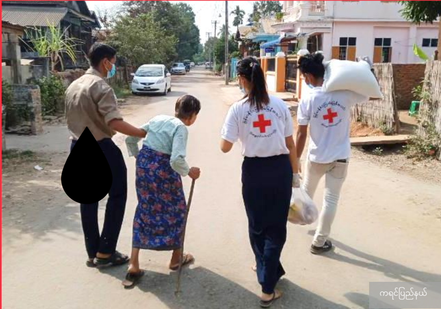
ကရင်ပြည်နယ်

#COVID19 ဆိုင်ရာ ဒေသတွင်း လှုပ်ရှားဆောင်ရွက်မှုများဖြင့် မြန်မာနိုင်ငံနှင့် ကမ္ဘာအနှံ့တွင် ထိခိုက်အလွယ်ဆုံးသူများကို ကူညီပံ့ပိုးခြင်း