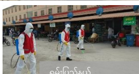
ရမ်းပြည်နယ်