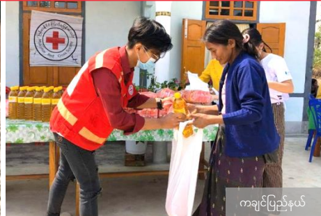
ကရင်ပြည်နယ်