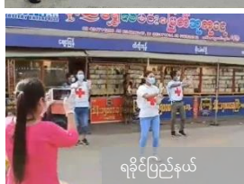
ရခိုင်ပြည်နယ်

၂၀၂၀ ပြည့်နှစ်၊ ဧပြီ ၉ ရက်နေ့အထိ MRCS အရေးပေါ်လုပ်ငန်းစီမံချက် (EPOA) ဆိုင်ရာ အလေးထား ဆောင်ရွက်ချက်များ