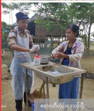
ရာဇဝတီတိုင်းဒေသကြီး