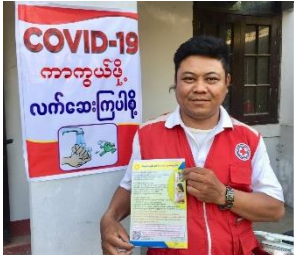
ကွင်းဆင်းလေ့လာမှုမှ ကြက်ခြေနီတို့၏ အသံများ

ကမ္ဘာလုံးဆိုင်ရာ ကိန်းဂဏန်းများကို လေ့လာရန် ယခုလင့်ခ် ကိုနှိပ်ပါ။ here