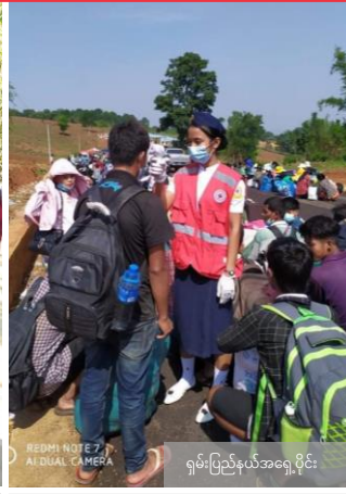
ရှမ်းပြည်နယ်အရှေ့ပိုင်း

COVID-19 နှင့်စပ်လျဉ်းသည့် မြန်မာနိုင်ငံကြက်ခြေနီအသင်း၏ လှုပ်ရှားဆောင်ရွက်မှုများနှင့် အချိန်တိုင်းအတွက် လက်ထွန်းပေးသော အခြေခံမူ ၇ ချက်