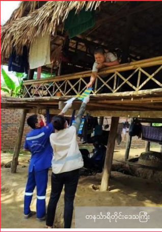
တနင်္သာရီတိုင်းဒေသကြီး