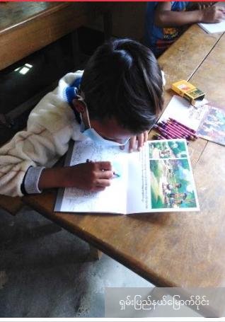
ရှမ်းပြည်နယ်မြောက်ပိုင်း