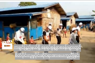
ကချင်ပြည်နယ်ရှိ နေရပ်စွန့်ခွာစခန်းများတွင် စိတ်ပိုင်းလူမှုပိုင်းဆိုင်ရာအားပေးကူညီခြင်း