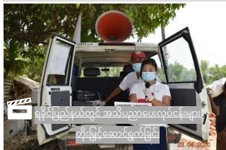
ရခိုင်ပြည်နယ်တွင် အသိပညာပေးလုပ်ငန်းများ တိုးမြှင့်ဆောင်ရွက်ခြင်း