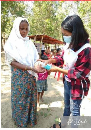
ရခိုင်ပြည်နယ်