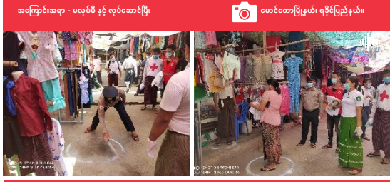
အကြောင်းအရာ - မလုပ်မီ နှင့် လုပ်ဆောင်ပြီး၊ မောင်တော်မြို့နယ်၊ ရခိုင်ပြည်နယ်။