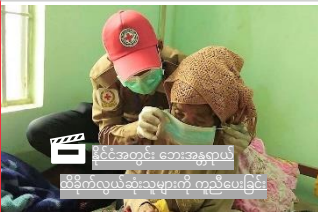
နိုင်ငံခြားတွင်း ဘေးအန္တရာယ် ထိခိုက်လွယ်ဆုံးသူများကို ကူညီပေးခြင်း

မြန်မာနိုင်ငံကြက်ခြေနီအသင်းသည် တရုတ်နိုင်ငံနှင့် ထိုင်နိုင်းတို့ကိုသို့ အိမ်နီးချင်းနိုင်ငံများမှ မိမိနေရပ်သို့ပြန် လာမည့် နေရပ်ပြန်ပြည်သူများနှင့် ရွှေ့ပြောင်းသွားလာ နေထိုင်သူများ အတွက် အလွန် စိုးရိမ်ပူပန်လျက်ရှိပါသည်။ တရုတ်နိုင်ငံနှင့် ထိုင်နိုင်းနိုင်ငံများသားမက ရပ်ရွာ အခြေပြု စောင့်ကြပ်ကြည့်ရှုရေးစခန်းများသည် လေ့ကျင့် သင်ကြားပေးထားသော ကြက်ခြေနီစေတနာ့လုပ်အားရှင် များကိုလေ့လာခြင်းစသည့် အသင်း၏ တိုင်းဆိုင်ရာ ဆောင်ရွက် ရေး လှုပ်ရှားဆောင်ရွက်မှုများတွင် အဆိုပါ သူများကို ဦးစားပေး ဆောင်ရွက်လျက်ရှိပါသည်။