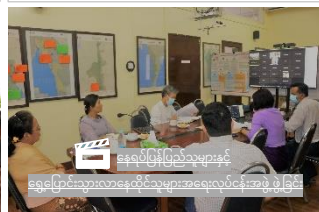
နေရပ်ပြန်ပြည်သူများနှင့် ရွှေ့ပြောင်းသွားလာနေထိုင်သူများအလေ့လာသင်အားပေးပွဲ ဖြစ်ခြင်း

စောင့်ကြည့်လွှာ (FUI) ၄၂၃ ဦး ရောဂါရှိကြောင်း အတည်ပြုလူနာ ၂၀၃ ဦး လေဆုံးလူနာ ၆ ဦး၊ မြန်မာပြည်သက်သာရေးအဖွဲ့ ၁၃၉ ဦး သတင်းရင်းမြစ် Surveillance Dashboard ကမ္ဘာလုံးဆိုင်ရာကိန်းကစားများကို လေ့လာရန် here ကိုနှိပ်ပါ။