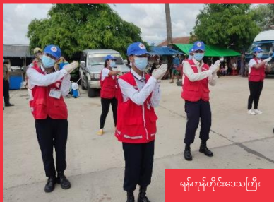
ရန်ကင်းတိုင်းဒေသကြီး