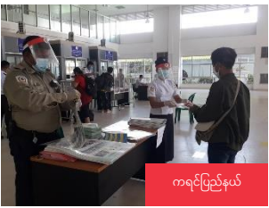
ကရင်ပြည်နယ်