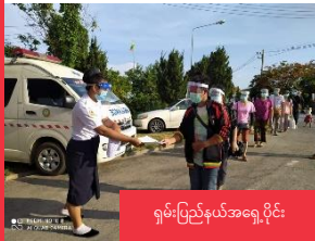
ရှမ်းပြည်နယ်အရှေ့ပိုင်း