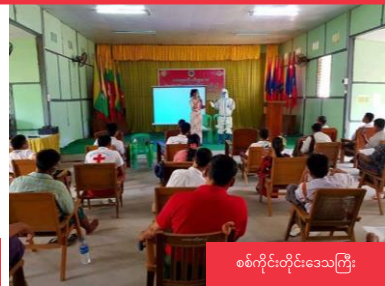
စစ်ကိုင်းတိုင်းဒေသကြီး