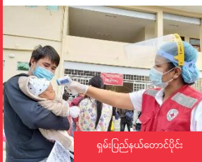
ရှမ်းပြည်နယ်တောင်ပိုင်း