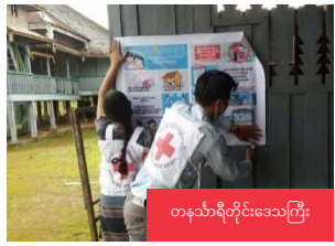
တနင်္သာရီတိုင်းဒေသကြီး