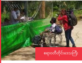
ရောဂါတိုင်းဒေသကြီး