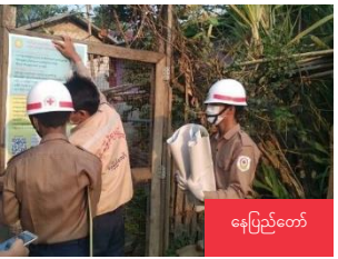
နေပြည်တော်