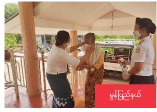
မွန်ပြည်နယ်