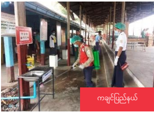
ကချင်ပြည်နယ်