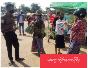
မကွေးတိုင်းဒေသကြီး