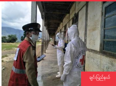
ချင်းပြည်နယ်