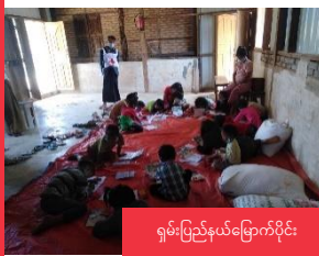
ရှမ်းပြည်နယ်မြောက်ပိုင်း

မြန်မာနိုင်ငံတော်အစိုးရ၏ လူသားချင်းစာနာထောက်ထားမှုဆိုင်ရာ လှူဒါန်းမှုများတွင် အရန်အင်အားအဖြစ် ဆောင်ရွက်ပေးနေသော မြန်မာနိုင်ငံကြက်ခြေနီအသင်း၏ အခန်းကဏ္ဍကို မြန်မာနိုင်ငံ ကြက်ခြေနီအသင်းဥပဒေတွင် အတိအလင်းဖော်ပြထားပြီး ၂၀၁၅ ခုနှစ် ဩဂုတ်လတွင် အတည်ပြုပြဌာန်းခဲ့ပါသည်။ အသင်းသည် ပြည်နယ်နှင့်တိုင်းဒေသကြီး ၁၇ ခုတွင် အသင်းခွဲပေါင်း ၃၀၀ တွင် ရပ်ရွာအခြေပြု ကြက်ခြေနီစေတနာ့လုပ်အားရှင်ပေါင်း ၄၄,၀၀၀ ဖြင့် စည်းစနစ်ကျသော လူမှုကရုဏာအဖွဲ့အစည်းတစ်ခုအနေဖြင့် ဖွဲ့စည်းတည်ရှိထားသလို အစိုးရ၏ လူမှုကရုဏာလုပ်ငန်းတွင် အရန်အင်အားအဖြစ်ပါတည်ရှိပါသည်။