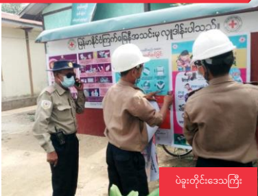
ပဲခူးတိုင်းဒေသကြီး