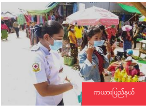
ကယားပြည်နယ်