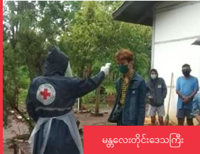
မန္တလေးတိုင်းဒေသကြီး