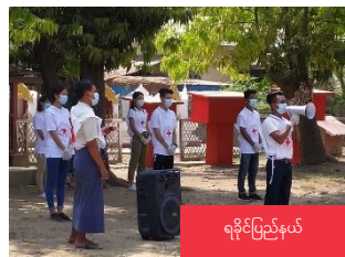
ရခိုင်ပြည်နယ်