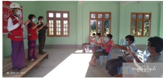
ကချင်ပြည်နယ်

ထိခိုက်ဆုံးရှုံးနိုင်ခြေ အသိပေးခြင်းနှင့် ရပ်ရွာနှင့် ထိတွေ့ဆက်ဆံမှု နှင့် တာဝန်ယူမှု တာဝန်ခံမှု သည် ရပ်ရွာပြေငြိမ်းချက်များအကြောင်းကို သိရှိစေပြီး ပံ့ပိုးပေးရန်နှင့် ဖြစ်ပေါ်နေသော ပဟေဠိများ၊ စိုးရိမ်ပူပန်မှုများနှင့် ကောလဟာလများကို နားလည်စေပြီး ဖြေရှင်းပေးရန်အတွက် ထိရောက်ကောင်းမွန်သော နည်းလမ်းတစ်ခုဖြစ်သည်။ သို့မှသာ ၎င်းတို့ကိုယ်တိုင်နှင့် ၎င်းတို့ချစ်ခင်ရသူများအတွက် လက်တွေ့ကျပြီး မှန်ကန်သောဆုံးဖြတ်ချက်များကို ချမှတ်နိုင်စေမှာ ဖြစ်သည်။ အသင်း၏ CEA ဆိုင်ရာ အနည်းဆုံး စံသတ်မှတ်ချက်များကို အသုံးပြုပြီး ပြန်လည်ဖြေကြားမှုအတွက် ပြင်ဆင်ထားပါသည်။ ဝန်ထမ်းများနှင့် ကြက်ခြေနီစေတနာလုပ်အားရှင်များအားလည်း စေတနာလုပ်အားရှင်များအတွက် ကပ်ရောဂါထိန်းချုပ်ရေး သင်တန်းများ ECV နှင့် ရပ်ရွာတွင်း ဆင့်ပွားသင်တန်းများတွင်(CEA) နည်းစနစ်များနှင့်စပ်လျဉ်း၍ ထည့်သွင်းသင်ကြားလေ့ကျင့်ပေးပြီးဖြစ်သည်။ အသင်းအနေဖြင့် ရပ်ရွာလူထုအားစည်းရုံးရေးနှင့် COVID-19 ရောဂါ ကြိုတင်ကာကွယ်ထိန်းချုပ်ရေးဆိုင်ရာ သတင်းအချက်အလက်များကို ဖြန့်ဝေရာတွင် ကျန်းမာရေးနှင့် အားကစားဝန်ကြီးဌာနမှ သင်တော်ကုပစ္စည်းများ (IEC) များကို အသိပညာပေးရေးလှုပ်ရှားမှုများတွင် တစ်ဦးနှင့်တစ်ဦး အကွာအဝေးခြားနားနေရာယူခြင်းနှင့် အသံချစ်စက်ဖြင့် အသိပေးများကို ဆောင်ရွက်လျက်ရှိသည်။ အရေးကြီးဆုံးအချက်မှာ အသင်း၏ လုပ်ငန်းများကို ပိုမိုတိုက်အောင်လုပ်ဆောင်နိုင်စေရန်အတွက် ရပ်ရွာလူထုထံ ထင်မြင်အကြံပြုချက်များကို နားထောင်ပြီး ပြန်လည်သုံးသပ်ကာ လုပ်ငန်းအစီအစဉ်များကို ပြင်ဆင်ပြီး ဆောင်ရွက်မှုများကို အရှိန်အဟုန်ဖြင့် တိုးချဲ့ဆောင်ရွက်လျက်ရှိသည်။