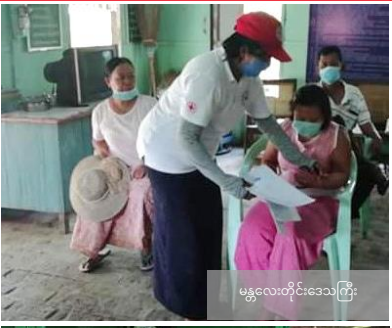
မန္တလေးတိုင်းဒေသကြီး