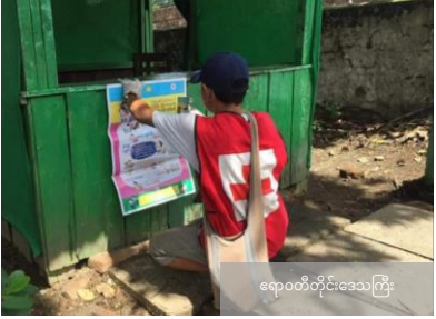
ရောဝတီတိုင်းဒေသကြီး

ကြက်ခြေနီစေတနာလုပ်အားရှင်များ၏ လှုပ်ရှားမှုပုံရိပ်များ - ရောဂါကာကွယ်ရေးအတွက် ဒေသခံ ဘာသာစကားဖြင့် သတင်းအချက်အလက်များကို ဖျေဝေပြောကြားခြင်းသည် အလွန်အထောက်အကူဖြစ်သည်။