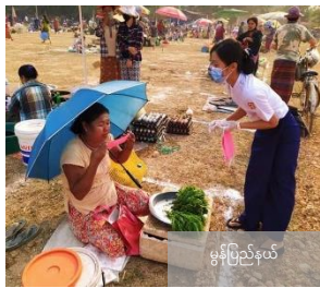
မွန်ပြည်နယ်