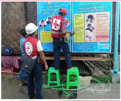
ကချင်ပြည်နယ်

ကြက်ခြေနီစေတနာလုပ်အားရှင်များ၏ လှုပ်ရှားမှုပုံရိပ်များ - ရောဂါကာကွယ်ရေးအတွက် ဒေသခံ ဘာသာစကားဖြင့် သတင်းအချက်အလက်များကို ဖျေဝေပြောကြားခြင်းသည် အလွန်အထောက်အကူဖြစ်သည်။