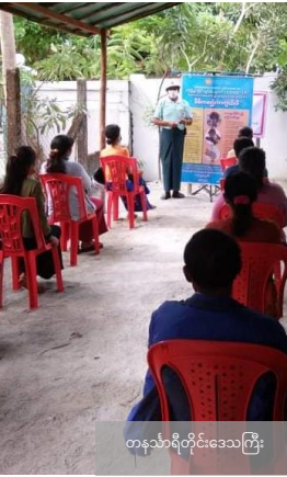
တနင်္သာရီတိုင်းဒေသကြီး