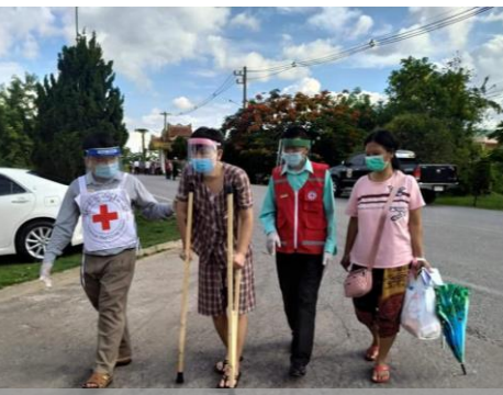
ထိုင်းနိုင်ငံမှ နေရပ်ပြန်များအား ၎င်းတို့ သုံးပါးကြားနေထိုင်ရမည့် အသွားအလာကန့်သတ်စောင့်ကြပ်ကြည့်ရှုရေးစင်တာသို့ ကူညီပို့ဆောင်ပေးနေသော ကိုလော်နီး များ။

ထိခိုက်ဆုံးရှုံးနိုင်ခြေ အသိပေးခြင်းနှင့် ရပ်ရွာနှင့် ထိတွေ့ဆက်ဆံမှု နှင့် တာဝန်ယူမှု တာဝန်ခံမှု သည် ရပ်ရွာပြေငြိမ်းချက်များအကြောင်းကို သိရှိစေပြီး ပံ့ပိုးပေးရန်နှင့် ဖြစ်ပေါ်နေသော ပဟေဠိများ၊ စိုးရိမ်ပူပန်မှုများနှင့် ကောလဟာလများကို နားလည်စေပြီး ဖြေရှင်းပေးရန်အတွက် ထိရောက်ကောင်းမွန်သော နည်းလမ်းတစ်ခုဖြစ်သည်။ သို့မှသာ ၎င်းတို့ကိုယ်တိုင်နှင့် ၎င်းတို့ချစ်ခင်ရသူများအတွက် လက်တွေ့ကျပြီး မှန်ကန်သောဆုံးဖြတ်ချက်များကို ချမှတ်နိုင်စေမှာ ဖြစ်သည်။ အသင်း၏ CEA ဆိုင်ရာ အနည်းဆုံး စံသတ်မှတ်ချက်များကို အသုံးပြုပြီး ပြန်လည်ဖြေကြားမှုအတွက် ပြင်ဆင်ထားပါသည်။ ဝန်ထမ်းများနှင့် ကြက်ခြေနီစေတနာလုပ်အားရှင်များအားလည်း စေတနာလုပ်အားရှင်များအတွက် ကပ်ရောဂါထိန်းချုပ်ရေး သင်တန်းများ ECV နှင့် ရပ်ရွာတွင်း ဆင့်ပွားသင်တန်းများတွင်(CEA) နည်းစနစ်များနှင့်စပ်လျဉ်း၍ ထည့်သွင်းသင်ကြားလေ့ကျင့်ပေးပြီးဖြစ်သည်။ အသင်းအနေဖြင့် ရပ်ရွာလူထုအားစည်းရုံးရေးနှင့် COVID-19 ရောဂါ ကြိုတင်ကာကွယ်ထိန်းချုပ်ရေးဆိုင်ရာ သတင်းအချက်အလက်များကို ဖြန့်ဝေရာတွင် ကျန်းမာရေးနှင့် အားကစားဝန်ကြီးဌာနမှ သင်တော်ကုပစ္စည်းများ (IEC) များကို အသိပညာပေးရေးလှုပ်ရှားမှုများတွင် တစ်ဦးနှင့်တစ်ဦး အကွာအဝေးခြားနားနေရာယူခြင်းနှင့် အသံချစ်စက်ဖြင့် အသိပေးများကို ဆောင်ရွက်လျက်ရှိသည်။ အရေးကြီးဆုံးအချက်မှာ အသင်း၏ လုပ်ငန်းများကို ပိုမိုတိုက်အောင်လုပ်ဆောင်နိုင်စေရန်အတွက် ရပ်ရွာလူထုထံ ထင်မြင်အကြံပြုချက်များကို နားထောင်ပြီး ပြန်လည်သုံးသပ်ကာ လုပ်ငန်းအစီအစဉ်များကို ပြင်ဆင်ပြီး ဆောင်ရွက်မှုများကို အရှိန်အဟုန်ဖြင့် တိုးချဲ့ဆောင်ရွက်လျက်ရှိသည်။