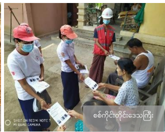
စစ်ကိုင်းတိုင်းဒေသကြီး