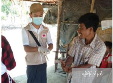
ရခိုင်ပြည်နယ်