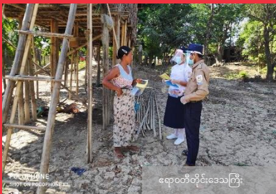
ရောဂါတိုင်းဒေသကြီး

ကိုဗစ်-၁၉ ဆိုင်ရာ သတင်းအချက်အလက်များနှင့် အကျိုးသက်ရောက်မှုများကို ပြည်သူလူထုအား အသိပေးစေရန်နှင့် လူထုပေါင်းပါဝင်လာအောင် စည်းရုံးပြောဆိုခြင်း