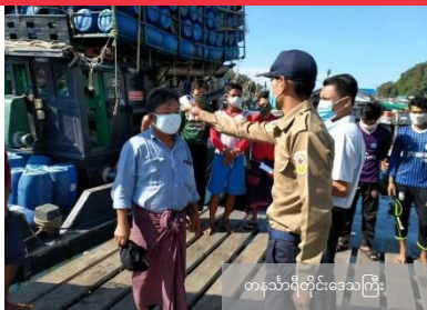
ကနဦးတိုင်းဒေသကြီး

ကိုဗစ်-၁၉ ဆိုင်ရာ သတင်းအချက်အလက်များနှင့် အကျိုးသက်ရောက်မှုများကို ပြည်သူလူထုအား အသိပေးစေရန်နှင့် လူထုပေါင်းပါဝင်လာအောင် စည်းရုံးပြောဆိုခြင်း