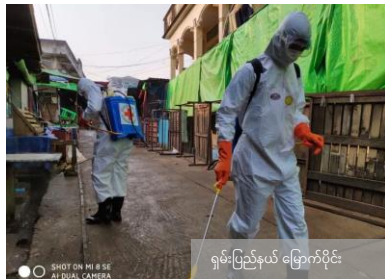
ရုမ်းပြည်နယ် မြောက်ပိုင်း

ဦးတည်ပြည်နယ်များနှင့် တိုင်းဒေသကြီးများ - ပြည်နယ်နှင့် တိုင်းဒေသကြီး ၁၇ ခုလုံး