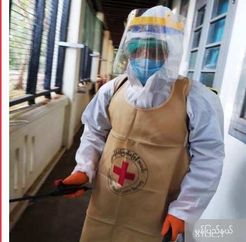
မွန်ပြည်နယ်