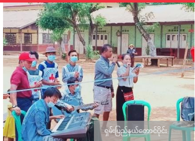
ရုမ်းပြည်နယ်တောင်ပိုင်း

အစိုးရအား ပံ့ပိုးကူညီသည့် လှူဒါန်းမှုများ