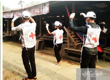
ရခိုင်ပြည်နယ်

ရန်ပုံငွေ လိုအပ်ချက် - မြန်မာကျပ်ငွေ ၃,၀၅၇,၀၀၀,၅၀၀ (ခန့်မှန်းခြေ အမေရိကန်ဒေါ်လာ ၂,၁၉၀,၀၆၀)