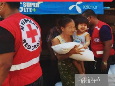
မွန်ပြည်နယ်

မိတ်ပိုင်းလူမှုပိုင်းဆိုင်ရာ အားပေးကူညီခြင်း