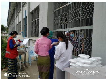
ကချင်ပြည်နယ်

ပါဝင်ဆောင်ရွက်နေကြသော MRCS ဝန်ထမ်း - နိုင်ငံအနှံ့ MRCS အသင်းခွဲပေါင်း ၃၃၀ မှ MRCS ဝန်ထမ်း ၇၅၀ ဦး နှင့် ကြက်ခြေနီစေတနာ့လုပ်အားရှင် ၄,၀၀၀ + ဦး