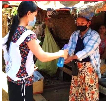
ရောဂါပိုးပျံ့နှံ့မှုကို တားဆီးကာကွယ်ခြင်း