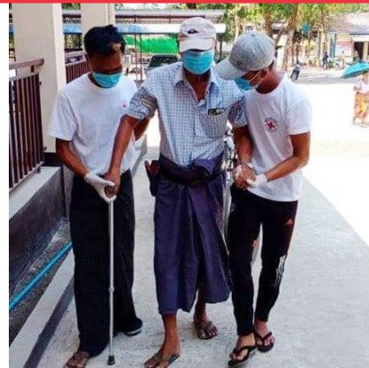
ထိခိုက်လွယ်ဆုံးသူများနှင့် ၎င်းတို့၏ လိုအပ်ချက်များကို ဂရုစိုက်ပြုစုစောင့်ရှောက်ခြင်း

၂၀၂၀ ပြည့်နှစ် ဧပြီလ ၂၇ ရက် ည ၇ နာရီ အထိ ကျန်းမာရေးနှင့် အာကစားဝန်ကြီးဌာန (MoHS) မှ နောက်ဆုံးရ စာရင်းများ စောင့်ကြည့်လူနာ/သံသယလူနာ (PUI) စုစုပေါင်း ၂,၈၅၀ ဦး ရောဂါရှိကြောင်း အတည်ပြုလူနာ ၁၄၆ ဦး သေဆုံးလူနာ ၅ ဦး ပြန်လည်သက်သာလာသူဦးရေ ၁၆ ဦး သတင်းရင်းမြစ် - Surveillance Dashboard ကမ္ဘာ့အဆင့်ရာ ကိန်းဂဏန်းများ here