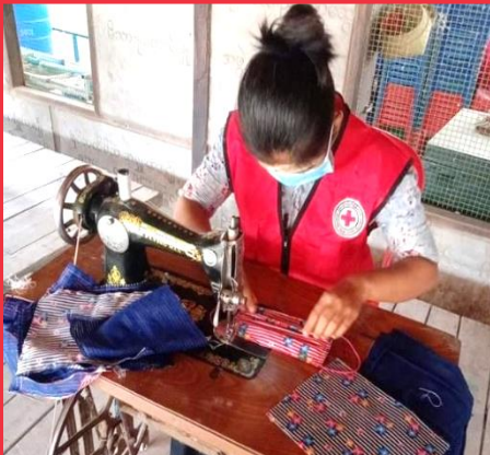
ဒေသခံလုပ်ချက်များကိုနားထောင်၍ ဒေသတွင်း ဖြေရှင်းချက်များကို ဖော်ထုတ်ခြင်း

#COVID19 ဆိုင်ရာ ဒေသတွင်း လှုပ်ရှားဆောင်ရွက်မှုများဖြင့် မြန်မာနိုင်ငံနှင့် ကမ္ဘာအနှံ့တွင် ထိခိုက်အလွယ်ဆုံးသူများကို ကူညီပံ့ပိုးခြင်း