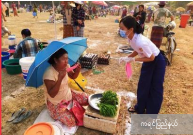
ကရင်ပြည်နယ်

အခြေခံလိုအပ်ချက်များကို တိုးမြှင့်ပေးအပ်ခြင်း