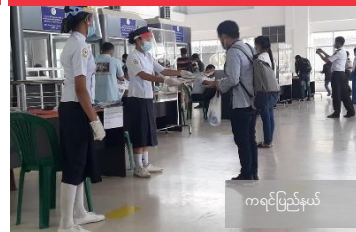
ကရင်ပြည်နယ်