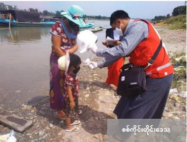
စစ်ကိုင်းတိုင်းဒေသ