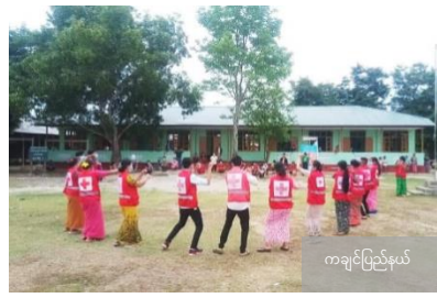
ကချင်ပြည်နယ်