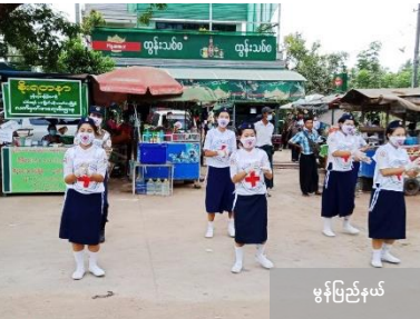
မွန်ပြည်နယ်