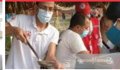
မန္တလေးတိုင်းဒေသကြီး