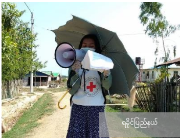
ရိုင်းပြည်နယ်