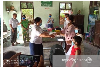
ရောဝတီတိုင်းဒေသကြီး

ကိုဏ်-၁၉ ဆိုင်ရာ သတင်းအချက်အလက်များနှင့် အကျိုးဆောင်ရွက်ရန်အတွက် ပြည်သူလူထုအား အသိပေးပေးခြင်းနှင့် လူထုဖွဲ့စည်းပေးခြင်း၊ မိတ်ဆက်ဆောင်ရွက်ခြင်း၊ စည်းရုံးပြောဆိုခြင်း