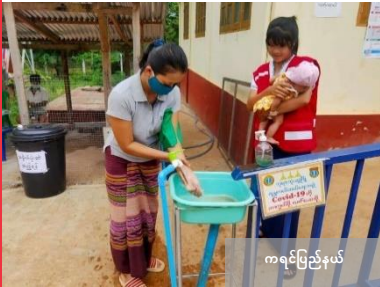
ကရင်ပြည်နယ်