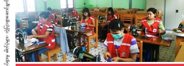
အကြောင်းအရာ - စခန်းဆင်းစိတ်များအားလုပ်ဆောင်နေခြင်း