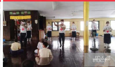
မွန်ပြည်နယ်