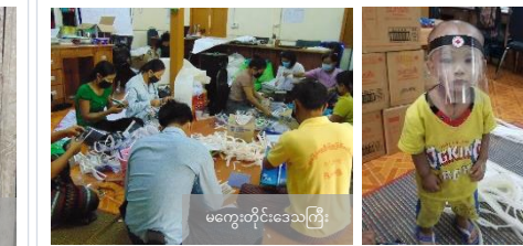
မကွေးတိုင်းဒေသကြီး

မကွေးတိုင်းဒေသကြီး၊ မြို့နယ်မြို့နယ်ကြားရှိအသင်းခွဲမှ ဒိန်းမတ် ကြက်ခြေအသင်း၏ ထောက်ပံ့မှုဖြင့် ယခုကဲ့သို့ COVID-19 ဖြစ်ပွားနေချိန်တွင် ကလေးသူငယ်များအား ကာကွယ်ဆေးထိုးဆေး COVID-19 ရောဂါကာကွယ်မှု ထားဆီး ရေးအတွက် ကြိုတင်ပြင်ဆင်မှုတစ်ရပ်အနေဖြင့် မြို့နယ်အတွင်းရှိ ကလေးသူငယ်များ အားလုံးကို ဖြန့်ဝေပေးနိုင်ရန် လက်လုပ် မျက်နှာအကာ ၂၅၀၀ ခုကို ပြုလုပ်လျက်ရှိ ပါသည်။