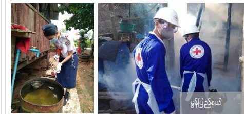
မွန်ပြည်နယ်

နိုင်ငံအနှံ့ရှိ မြို့နယ်ကြားရှိအသင်းခွဲများသည် ရပ်ရွာအတွင်း COVID-19 လှုပ်ရှားမှုများ နှင့် မြန်မာနိုင်ငံတွင် သွေးလွန်တုပ်ကွေးရောဂါဖြစ်ပွားမှုနှုန်း ပိုမိုများပြားလေ့ရှိသည့် မှတ်သန်ရာသီတွင် ကြိုတင်ပြင်ဆင်မှုများအဖြစ် သွေးလွန်တုပ်ကွေး ရောဂါကာကွယ်ရေး သတိပေးစကားများကို လိုက်လံနီးဆော်လျက် ရှိပါသည်။ ထို့အပြင် ခြင်ဆေးခြင်း ကိုလည်း ပြည့်သူ့ကျန်းမာရေးညှိစီးဌာနနှင့် ပူးပေါင်းဆောင်ရွက်လျက်ရှိသည်။