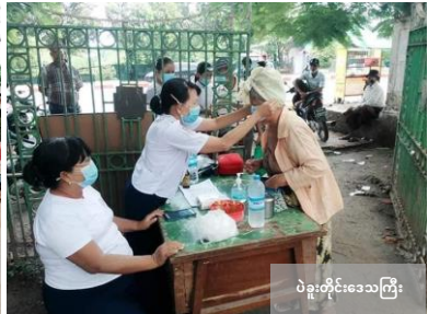
ပဲခူးတိုင်းဒေသကြီး

ရောဂါကာကွယ်ရေးအတွက် အသွားအလာကန့်သတ်ထားသည့်အချိန်များတွင် ရပ်ရွာလူထုကို အသိပညာပေးခြင်းနှင့် လူသားချင်းစာနာထောက်ထားသည့် လှုပ်ရှားဆောင်ရွက်မှုများပြုလုပ်နေသည့် ကြက်ခြေနီစေတနာ့လုပ်အားရှင်များအား ကျေးဇူးတင်ရှိပါသည်။