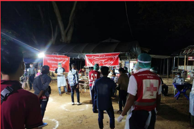
မွန်ပြည်နယ် - ထိုင်းနိုင်ငံမှ နေရပ်ပြန်လာသည့် သူများအား ကိုယ်အပူချိန်တိုင်းတာခြင်း နှင့် စာရင်းသွင်းခြင်း။