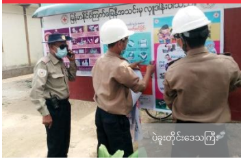
ပဲခူးတိုင်းဒေသကြီး

ရပ်ရွာလူထု အာဟာရ ပြည့်ဝစေရန် ရည်ရွယ်၍ အာဟာရပြည့်ဝအစားအစာများကို ဖြန့်ဝေပေးခဲ့ပါသည်။