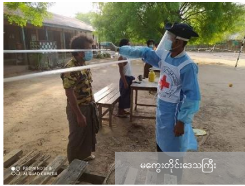
မကွေးတိုင်းဒေသကြီး