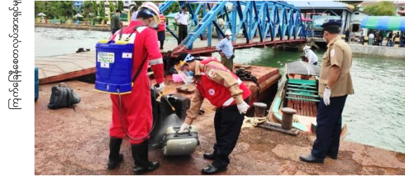
အသင်း၏ ကြက်ခြေနီစေတနာ့လုပ်အားရှင်များ၏ COVID-19 ကာကွယ်ရေး လုပ်ဆောင်နေသည့် ဓါတ်ပုံများ သင့်ထံတွင် ရှိပါသလား။ ရှိပါက ကျွန်ုပ်တို့ကို ဆက်သွယ်ပေးပို့နိုင်ပါသည်။ MRCS Facebook

ကြက်ခြေနီစေတနာ့လုပ်အားရှင်များ၏ လှုပ်ရှားမှုများ - လူကြားစုံဆောင်ရွက်ချက်များ