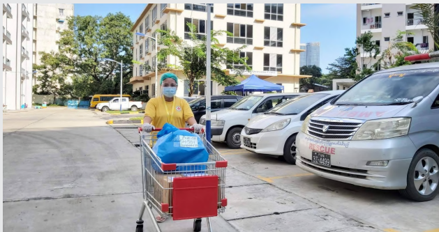
လက်ခံထားသည့် ပစ္စည်းများပေးဝေရန်ပြင်ဆင်ခြင်း

"ကွာရင်တင်းစင်တာကို နေ့တိုင်း လူနာသစ်တွေ အများကြီးရောက်လာနေတာကို မြင်နေရတာ ကျွန်မအတွက် အရမ်းဝမ်းနည်းရပါတယ်။ အများပြည်သူကိုပြောကြားချင်တာကတော့ကိုယ်ချစ်ခင်ရတဲ့သူတွေကို ကျေးဇူးပြုပြီး အပြင်မထွက်ဖို့နဲ့ ဂရုစိုက်ကြဖို့ ပြောချင်ပါတယ်။ စင်တာသို့ ရောက်လာတဲ့ လူနာများရဲ့ မိသားစုဝင်များ ပေးပို့လာတဲ့ အစားအသောက်များ၊ အဝတ်များနှင့် အသုံးအဆောင်ပစ္စည်းတွေကို ကြက်ခြေနီက နေ့စဉ် ကူညီပေးပို့ပေးနေပါတယ်။"