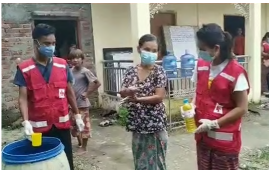
မြန်မာနိုင်ငံတွင် ကိုဗစ်-၁၉ ကူးစက်မှုသည် မကြာသေးမီကာလများအတွင်း လျှင်မြန်စွာ တိုးတက်လာသဖြင့် ရပ်ရွာများ၌အသိပညာမြှင့်တင်ခြင်းနှင့်လက်ဆေးခြင်းလှုပ်ရှားမှုများ တိုးမြှင့်လုပ်ဆောင်နေပါသည်။ ဗီဒီယို - ရခိုင်ပြည်နယ်။

ကျန်းမာရေး၊ ရေ၊ ပတ်ဝန်းကျင်သန့်ရှင်းရေး နှင့် တစ်ကိုယ်ရည်သန့်ရှင်းရေး။