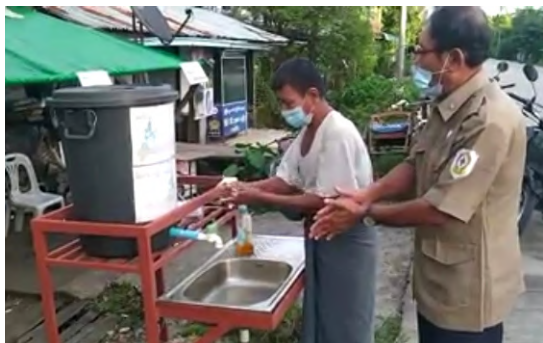
လူထုမှ မည်သို့ကာကွယ်ရမည်ကို ၎င်းတို့ကိုယ်တိုင်လေ့လာသင်ယူနိုင်မည့် အကောင်းဆုံးနည်းလမ်းများကို ကျွန်ုပ်တို့ သိရှိနားလည်ထားပါသည်။ လက်ကို စနစ်တကျ ဆေးကြောခြင်းသည် အရေးကြီးပါသည်။ ဗီဒီယို - ဧရာဝတီတိုင်း။

ကွာဟချက်များ - လူထုအတွက် ဆပ်ပြာနှင့် လက်ဆေး ဘေစင်များလိုအပ်ခြင်း။ - နှာခေါင်းစည်းနှင့် တစ်ဦးနှင့်တစ်ဦးအကွာအဝေးခြားနားစွာနေခြင်းကဲ့သို့သော အခြားရောဂါ ကာကွယ်ရေး အစီအမံများကိုသေချာစွာ မလိုက်နာခြင်း။ - ရောဂါ ကူးစက်မှုများနေသည့် နေရာများတွင် ကူညီနိုင်ရန်အတွက် အခက်အခဲရှိခြင်း။