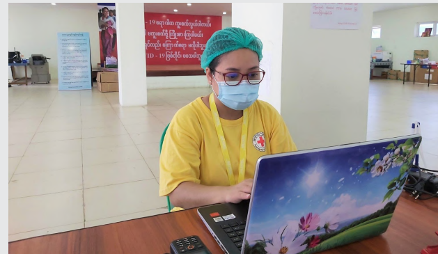
လူနာစာရင်းပြုစုခြင်းနှင့် နေ့စဉ်လုပ်ငန်းစဉ်များ မှတ်တမ်းတင်ခြင်း

"ကျွန်မတို့ မွန်ပြည်နယ်က ကြက်ခြေနီစေတနာလုပ်အားရှင်(၄၁)ဦး ရန်ကုန်မှာ အားဖြည့်ဆောင်ရွက်နေတာ တစ်လပြည့်ပါတော့မယ်။ အားလုံးသိတဲ့အတိုင်း ရန်ကုန်မှာ စိုးရိမ်ရတဲ့ အခြေအနေ ဖြစ်တဲ့အတွက် အားဖြည့်ကူညီဖို့ ဆုံးဖြတ်ပြီး ရောက်ရှိလာတာပါ။ စည်းလုံးညီညွတ်ခြင်းသည် ကြက်ခြေနီအခြေခံမူထဲက အရေးကြီးတဲ့ အချက်တစ်ချက် ဖြစ်တဲ့အတွက် ကျွန်မတို့နည်းတူ အခြားတိုင်းဒေသကြီးပြည်နယ်များမှ လာရောက်ကူညီခြင်းက သက်သေပြနေပါတယ်။"