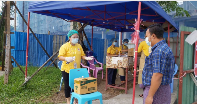
မိသားစုဝင်များမှ ပစ္စည်းများလက်ခံခြင်းနှင့် စစ်ဆေးခြင်း

"ကွာရင်တင်းစင်တာကို နေ့တိုင်း လူနာသစ်တွေ အများကြီးရောက်လာနေတာကို မြင်နေရတာ ကျွန်မအတွက် အရမ်းဝမ်းနည်းရပါတယ်။ အများပြည်သူကိုပြောကြားချင်တာကတော့ကိုယ်ချစ်ခင်ရတဲ့သူတွေကို ကျေးဇူးပြုပြီး အပြင်မထွက်ဖို့နဲ့ ဂရုစိုက်ကြဖို့ ပြောချင်ပါတယ်။ စင်တာသို့ ရောက်လာတဲ့ လူနာများရဲ့ မိသားစုဝင်များ ပေးပို့လာတဲ့ အစားအသောက်များ၊ အဝတ်များနှင့် အသုံးအဆောင်ပစ္စည်းတွေကို ကြက်ခြေနီက နေ့စဉ် ကူညီပေးပို့ပေးနေပါတယ်။"