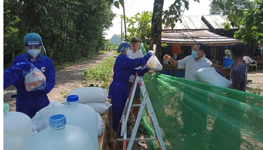
ကျွန်ုပ်တို့သည် ပုံမှန်ကာလမဟုတ်ပဲ ကန့်သတ်ချက်များထားရှိသည့်အချိန်များတွင် မိသားစုဝင်များ ကျန်းမာရေးနှင့် ဘေးအန္တရာယ်ကင်းရှင်းရေးအတွက် မရှိမဖြစ်လိုအပ်သော အစားအစာနှင့် ရေရရှိရန်အတွက် ကူညီပေးနေပါသည်။ ဓာတ်ပုံ - ကရင်ပြည်နယ်

လူမှုစီးပွားရေးသက်ရောက်မှုကို ဖြေရှင်းခြင်း။