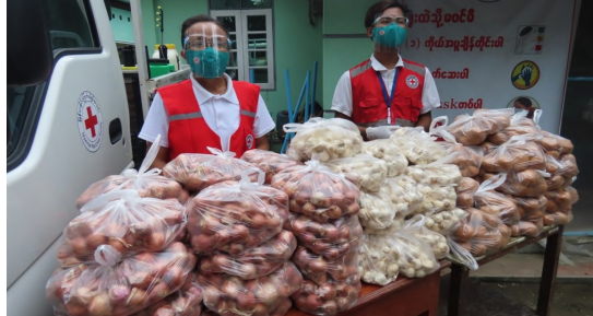
မကြာသေးမီက ကိုဗစ်-၁၉ ကူးစက်မှု ဆက်လက်မြင့်တက်လျက်ရှိရာ ရပ်ရွာလူထုအား ရောဂါကူးစက်မှု လျော့ကြစေရန်စေရန် RCV များက အချိန်များစွာ လုပ်ဆောင်ခဲ့ရပါသည်။ ထို့အတွက် RCV များကို အာဟာရပြည့်ဝသောအစားအစာများထောက်ပံ့ပေးခြင်းဖြင့် ကျန်းမာစွာနေထိုင်လှုပ်ရှားနိုင်ပါသည်။ ဓာတ်ပုံ - ရခိုင်ပြည်နယ်။

ကွာဟချက်များ - အသင်းခွဲများတွင်ကြက်ခြေနီစေတနာ့လုပ်အားရှင်များအတွက် PPE အလိုအလောက်မရှိခြင်း။ - အသင်းခွဲများတွင်ကြက်ခြေနီစေတနာ့လုပ်အားရှင်များ လှုပ်ရှားမှုပြုလုပ်ရန် ထောက်ပံ့ရန်ရန်ပုံငွေအလိုအလောက်မရှိခြင်း။ ဒေသခံအလှူရှင်များ၏ ထောက်ပံ့မှုကိုမကြာခင် လိုအပ်ခြင်း။