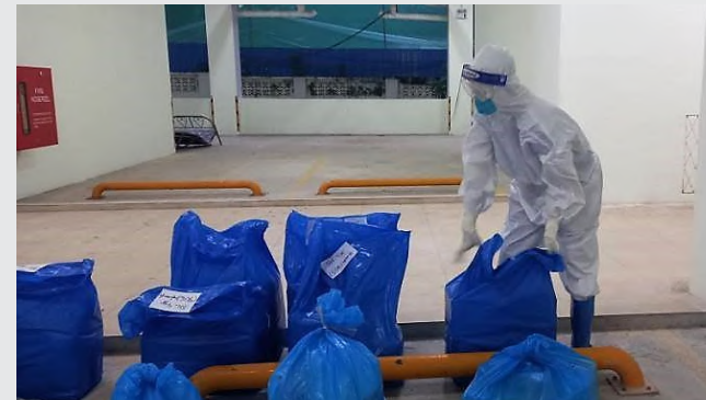
လူနာများကို ပစ္စည်းများပေးပို့ခြင်းနှင့် အမှိုက်သိမ်းခြင်း

"မွန်ပြည်နယ်မှ မထွက်ခွာမီ ကျွန်တော်ကို ရောဂါကူးစက်ခံရနိုင်သည့် အတွက် ပြန်မလာရန် လူအချို့ကပြောကြတယ်။ ကျွန်တော်က တစ်ကိုယ်ရည် ရောဂါကာကွယ်ရေးသုံးပစ္စည်း အပြည့်အစုံ (PPE) ဝတ်ပြီး လုပ်ဆောင်တာ ဖြစ်ပြီး မလုပ်ဆောင်မီမှာ သင်တန်းတက်ရအုန်းမယ်။ ပြန်လာရင်လည်း ကွာရင်တင်းထားအုန်းမှာလို့ ပြန်လည်တုံ့ပြန်ခဲ့ပါတယ်။ ကျွန်တော် မိသားစုကတော့ ကျွန်တော်ကို ထောက်ခံအားပေးပြီး ကျန်းမာရေး ဂရုစိုက်ရန်နှင့် ဘေးကင်းစွာ ဆောင်ရွက်ဖို့ မှာလိုက်ပါတယ်။"