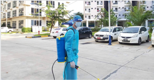
အဆောက်အဦများကို ပိုးသတ်ဆေးဖြန်းခြင်း (အထူးသဖြင့် လူနာသစ်များ ရောက်ရှိပြီးချိန်)