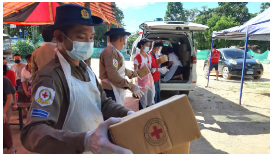
ကိုဗစ်-၁၉ ကြောင့် ထိုင်းနိုင်ငံရှိ မြန်မာနိုင်ငံသား အကျဉ်းသားအချို့ နိုင်ငံသို့ ပြန်ရောက်လာသည့်အတွက် တစ်ကိုယ်ရည်သန့်ရှင်းရေးသုံးပစ္စည်းများ၊ အမျိုးသမီးတစ်ကိုယ်ရည်သန့်ရှင်းရေးသုံးပစ္စည်းများနှင့် ထောက်ပံ့ငွေများကို ထောက်ပံ့ခဲ့ပါသည်။ ဓာတ်ပုံ - ရှမ်းပြည်နယ်(အရှေ့ပိုင်း)။

ကွာဟချက်များ - အခြေအနေမြန်မြန်ဆန်ဆန်ဖွံ့ဖြိုးလာချိန်တွင်လိုအပ်ချက်များကိုအကဲဖြတ်ရန်အချိန်ယူရခြင်း။ - ကိုဗစ်-၁၉ တုံ့ပြန်မှုအစီအစဉ်ကို အကောင်အထည်ဖော်ရန် ရန်ပုံငွေလိုလောက်မှုမရှိခြင်း။ - ဝင်ရောက်စွက်ဖက်မှု၏ သက်ရောက်မှုကိုတိုင်းတာရန်ခက်ခဲခြင်း။