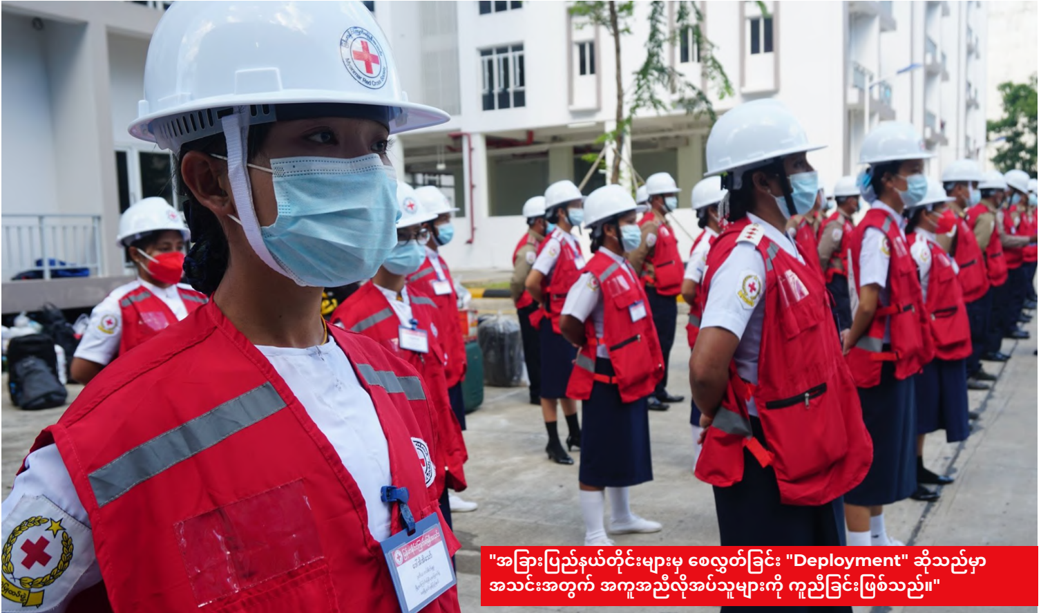
"အခြားပြည်နယ်တိုင်းများမှ စေလွှတ်ခြင်း "Deployment" ဆိုသည်မှာ အသင်းအတွက် အကူအညီလိုအပ်သူများကို ကူညီခြင်းဖြစ်သည်။"

အသင်း၏ မြန်မာနိုင်ငံအတွင်း အသက်ကူညီကယ်ဆယ်ရေး အမြင့်ဆုံးလှုပ်ရှားမှုများ